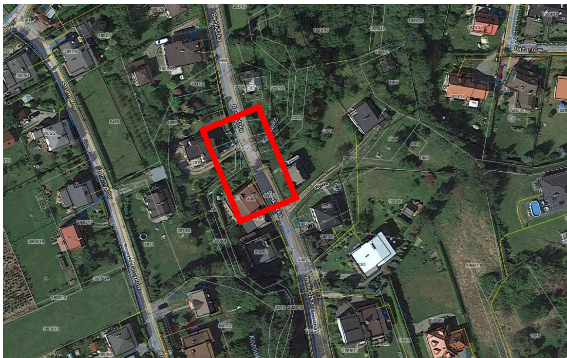
Lokalizacja przedmiotu inwestycji na ortofotomapie