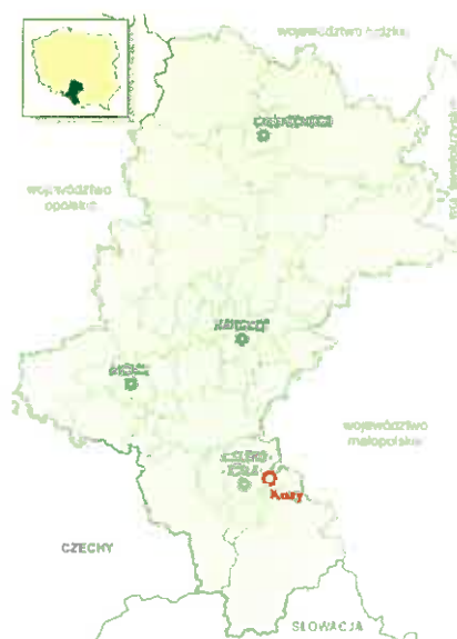
Rysunek 1. Usytuowanie Gminy Kozy w województwie śląskim.

Gmina Kozy położona jest w województwie śląskim, powiecie bielskim. Gmina Kozy, jako gmina jednosołecka, jest najliczniej zamieszkaną wsią w Polsce. Miejscowość jest atrakcyjnie położona u stóp gór Beskidu Małego, po obu stronach drogi krajowej z Bielska- Białej do Krakowa nr DK52. Pod względem podziału terytorialnego, Gmina leży w południowo-wschodniej części województwa śląskiego, w obrębie powiatu bielskiego. Od zachodu i południowo-zachodu graniczy z miastem Bielsko-Biała, od północy - z gminą Wilamowice, od południowego wschodu z gminą Czernichów, od wschodu z gminą Porąbka, od południa z Gminą Wilkowice, od północnego wschodu z Gminą Kęty i woj. małopolskim.